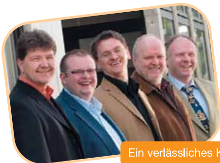
Ein verlässliches Kompetenz-Team...